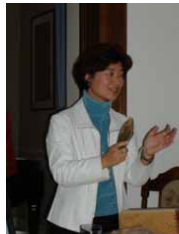
上野氏による日本食文化紹介