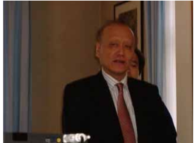
丸尾総領事によるご挨拶