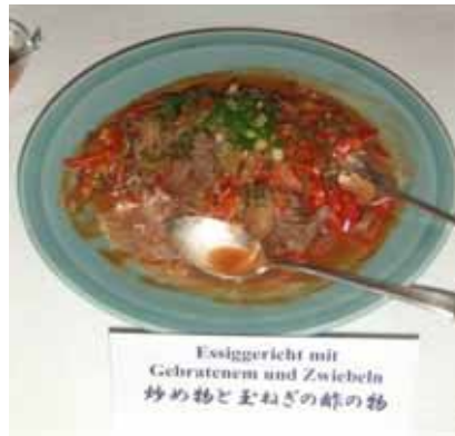
炒め物と玉ねぎの酢の物