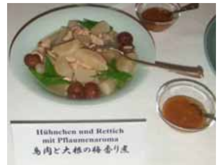
鶏肉と大根の梅香り煮