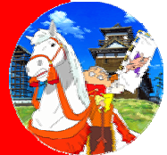
© 2002 Usui Yoshito. / Futabasha SHIN-EI Animation · TV Asahi Corporation. / All Rights Reserved