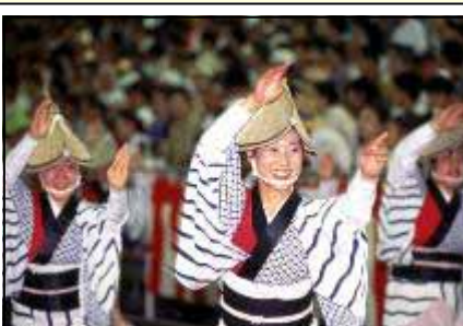
Awa-odori in Tokushima (Präf. Tokushima)

ANDERS als im klassischen westlichen Ballett ist traditioneller japanischer Tanz normalerweise „bodenlastig“. Sprünge, bei denen beide Beine längere Zeit in der Luft schweben, das Tänzeln auf der Fußspitze ( en pointe ),