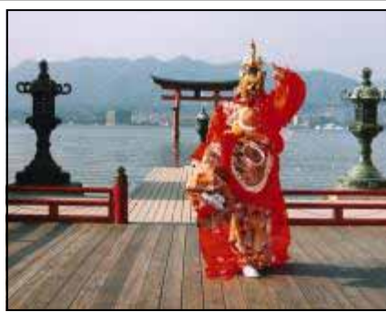
bugaku-Aufführung am Itsukushima-Schrein (Präf. Hiroshima)

MAN unterscheidet zwei traditionelle Haupt-Tanzarten in Japan: den gesetzten mai , aus dem sich auch Tänze wie das höfische bugaku , der aristokratische kōwaka-mai (ein Vorläufer des Nō-Tanzes) und der ruhige Kamigata-mai (Tanzstil mit Nō-Elementen aus der Kantō-Region um Kyōto und Ōsaka), entwickelten, und den lebhafteren odori , dessen buddhistische Form als nenbutsu-odori , bei dem man während des Tanzes Gebetsformeln sang, als Vorbild für den dramatisch-expressiven Kabuki-Tanz gilt. Verbindet man die Schriftzeichen für mai und odori , erhält man das Wort buyō , mit dem heutzutage „japanischer Tanz“ ( Nihon buyō )