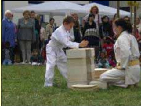
Junge Karate-ka beim demonstrieren des Bruchtests ( tameshi wari )

Dabei zeigten 24 junge Mitglieder des ASV Dojo e.V. Mönchengladbach bei gutem Wetter den über 1000 Besuchern des „Dorffestes“ und den im Friedensdorf untergebrachten Kindern aus Krisengebieten wie Afghanistan, Angola und der Kaukasus-Region, die zur medizinischen Behandlung nach Deutschland geholt wurden, in zwei halbstündigen Vorführungen Grundtechniken und Bewegungsabläufe im Karate und Jiū-jitsu . Bei beiden Sportarten steht nicht der Kampf, sondern die Selbstverteidigung im Vordergrund. Besonderen Applaus erhielten die Sportler für das sog.