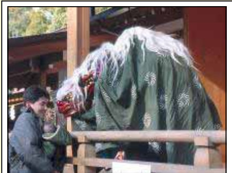
shishimai (Löwentanz) in Tōkyō

WIE das Kojiki („Aufzeichnungen alter Geschehnisse“, 712) zu berichten weiß, vermochte erst das Gelächter der 800 Myriaden Gottheiten über den frivol-erotischen Tanz der Ame no uzume no mikoto die schmolgende Sonnengöttin Amaterasu aus ihrer Höhle zu locken, in die sie sich aus Zorn über die mutwilligen Verwüstungen ihres Bruders Susanoo verkrochen hatte. Obwohl Neugier sie zum Herauskommen verleitete, wird schon hier das ursprüngliche Ziel des traditionellen Tanzes deutlich: das Gute zu beschwören, das Böse abzuwenden und mit den Göttern zu kommunizieren - schamanistische Vorstellungen, die in shintōistischen Ritualtänzen (kagura) und traditionellen Volkstänzen (minzoku-buyō) erhalten geblieben sind. Typisches Beispiel ist der Löwentanz ( shishimai ), mit dem man noch heute kleine Kinder erschrecken kann. Volkstänze werden in vielen Teilen Japans in regional sehr unterschiedlichen Ausprägungen gerade bei entsprechenden Festen ( matsuri ) gepflegt. Sie verbinden die Einheimischen im geselligen Miteinander, dienen als Ablenkung vom harten Arbeitsalltag, erlauben, „Dampf abzulassen“, und sind inzwischen eine beliebte Touristenattraktion geworden, was die Aufnahme von Show-Elementen begünstigt hat.