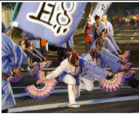
suzume-odori (Spatzen-Tanz) beim Aoba-matsuri in Sendai (Präf. Miyagi)

Ein weiterer Unterschied zu westlichem Tanz - die modernen Tanzformen seien hier ausgeklammert - besteht im nahezu vollständigen Fehlen des „Paartanzes“. Bei Volksfesten bewegen sich alle als Teil der Dorfgemeinschaft im gleichen Rhythmus und mit identischer Schrittfolge, ohne einander zu berühren oder in einer speziellen Mann-Frau-Konstellation aufeinander einzugehen. Auch in den Bühnenkünsten gibt es zwar Einzel- und Gruppentänze, aber normalerweise nicht das gezielte Zusammenwirken beider Geschlechter oder das Werben um einander. Tänze können im Einzelfall durchaus verführerisch auf den Zuschauer wirken, meist agiert ein Tänzer jedoch entweder als Solist - der „Tanzpartner“ kann dann ein Gegenstand sein (eine Maske, Blütenzweig, Gewand, Netz etc.) - oder in einer größeren Gruppe, bei der sich die Bewegungsmuster der männlichen und weiblichen Tänzer nicht erheblich voneinander unterscheiden. Auch verhüllt gerade bei Frauen das beim Tanzen getragene Gewand meist weitgehend den Körper; sie zeigen also kaum nackte Haut, Bein oder etwa Dekolleté. Kein Wunder, dass im 20. Jahrhundert westlicher Gesellschaftstanz in Japan lange Zeit als „unanständig“ verpönt war.