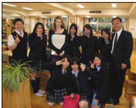
Undine mit dem Schulleiter (rechts), Englischlehrer (links) und Mitschülerinnen in der Chihaya High-school Ikebukuro, Tōkyō

de ernsthaft überlegten, ob sie mit dem Japanischlernen weiter machen sollten. Zum Fortführen haben sie ihre Japanreisen bewegt. Bei beiden war es die zweite Japanreise, die sie mit jeweils zehn Jahren machten, und bei der sie für ca. zwei Wochen die Schule besuchten. Während