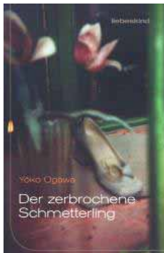
„Der zerbrochene Schmetterling“

OGAWAS Geschichten weisen oft einen gewissen „Gruselfaktor“ auf und sind dabei gerade in ihrer vermeintlichen Alltäglichkeit von subtiler Faszination. Im Lauf der Lektüre macht sich nicht selten eine gewisse Unruhe, manchmal sogar regelrecht Beklemmung breit, gerade weil vieles vage und diffus bleibt, nur angedeutet und nicht explizit ausgesprochen wird. Dabei gewinnt die Schilderung - häufig aus der Ich-Perspektive einer jungen Frau - besondere Intensität durch den klaren, schnörkellosen, minimalistisch anmutenden Stil Ogawas, der nüchtern-sezierend, fast unbarmherzig, dabei aber auch voller Poesie sein kann. Die Reduzierung auf das Wesentliche - ein Charakteristikum traditioneller japanischer Ästhetik - erinnert an ein Tuschebild, bei dem gerade die leeren, bewusst