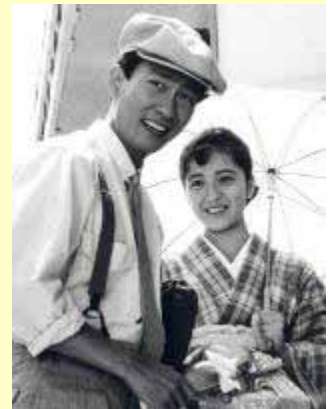
Die goldenen Tage des Films

(Keine Kartenreservierung; Kasse öffnet jew. 30 Min. vor Vorstellungsbeginn.)