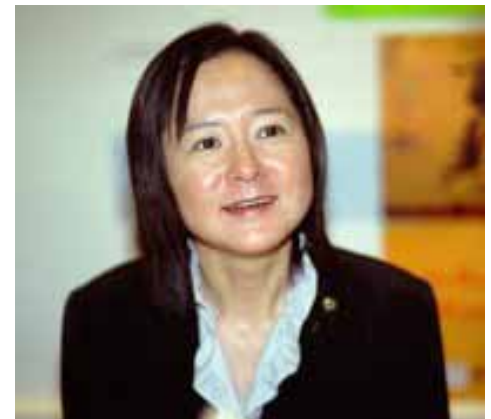
OGAWA Yōko bei ihrer Lesung im Japanischen Kulturinstitut in Köln im September 2003

rateten Frau zu ihrem todkranken leiblichen Bruder. - Im Roman „Museum der Stille“ ( Chinmoku hakubutsukan ) lässt eine alte Dame, die über Jahrzehnte heimlich unmittlerbar nach dem Tod jedes Dorfbewohners einen mit ihm in Verbindung stehenden Alltagsgegenstand entwendet hat, ihre stattliche Sammlung nun von einem jungen Mann für das von ihr geplante Museum