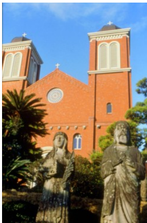
Urakami-Kathedrale in Nagasaki (1925 vollendet, 1945 durch die Atombombe zerstört, 1959 wieder aufgebaut)

NUR wenige Jahre, nachdem 1543 portugiesische Kaufleute als erste Europäer japanischen Boden betreten hatten, erreichten auch christliche Missionare das Land der aufgehenden Sonne. Denn der Kontakt mit einem japanischen Flüchtling namens Yajirō bzw. Anjirō in Malakka hatte den spanischen Jesuiten Francisco de Jassu y Xavier (1506-1552) bewogen, seine Tätigkeit auf Japan auszudehnen, und so traf er mit zwei spanischen Ordensbrüdern, Yajirō und weiteren Begleitern am 15. August 1549 in Kagoshima an der Südspitze Kyūshū ein. Von dem Ehrgefühl und der Höflichkeit der Einheimischen begeistert, begann er zu ihnen zu predigen und konnte so manchen für das Christentum gewinnen, obwohl Yajirō - wie sich bald zeigen sollte - der schwierigen Aufgabe des Übersetzens nicht gewachsen war. Zur Vermeidung sprachlicher Missverständnisse griff man mehr und mehr auf europäische Termini zurück, was allerdings die Allgemeinverständlichkeit nicht immer erhöhte. Nach Xaviers Weiterreise nach China (1551) führten seine Begleiter seine Missionstätigkeit fort und verzeichneten bald ebenfalls Erfolge, zumal sie die Einheimischen auch durch ihr soziales Engagement - z.B. durch die Errichtung von Krankenhäusern und Kinderheimen - beeindruckten.