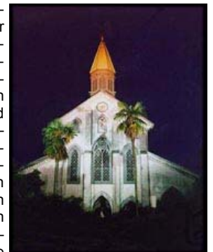
Ōura-Kirche in Nagasaki (1865; älteste Kirche Japans, einziges Gebäude im westlichen Stil unter den als Nationalschatz anerkannten Bauwerken Japans)