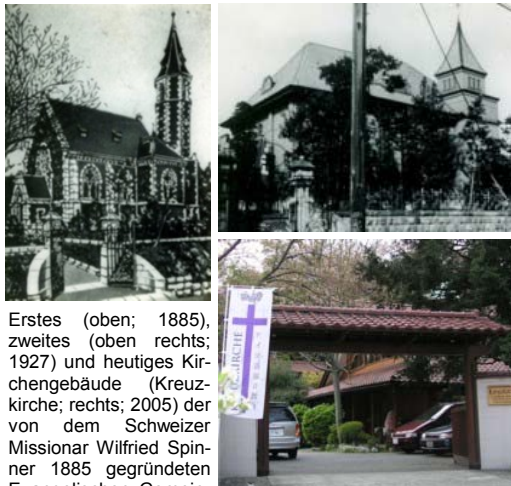
Erstes (oben; 1885), zweites (oben rechts; 1927) und heutiges Kirchengebäude (Kreuzkirche; rechts; 2005) der von dem Schweizer Missionar Wilfried Spinner 1885 gegründeten Evangelischen Gemeinde Deutscher Sprache Tōkyō/Yokohama

DEM „Statistical Survey on Religion“ zufolge gab es im Jahre 2002 in Japan 1,917 Mio. Christen in 4.378 Kirchengemeinden und 5.022 weiteren religiösen Körperschaften, betreut von rund 28.000 Geistlichen. Damit machen Christen im Vergleich zur Gesamtbevölkerung Japans nur ca. 1,5% aus; ihr Anteil ist also - und dies übrigens seit Jahrzehnten - verschwindend gering, auch wenn angenommen wird, dass die Zahl der nicht in dieser offiziellen Erhebung erfassten Christen das Zwei- bis Dreifache beträgt. Wie Wissenschaftler aufgezeigt haben, konnte das Christentum in Japan offensichtlich nur in Zeiten ernsthafter sozialer Probleme oder politischer Instabilität -