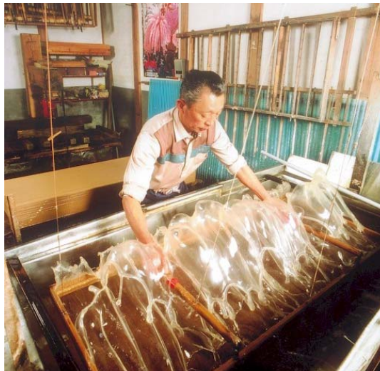
Papierschöpfer bei der Arbeit

her finden sich im Shōsōin, dem kaiserlichen Schatzhaus des Tōdaiji in Nara, neben vielerlei kostbaren Kunstwerken auch Papierbögen und -bündel von ausgesuchter Schönheit, die offensichtlich als den anderen Kunstgegenständen ebenbürtig angesehen wurden.