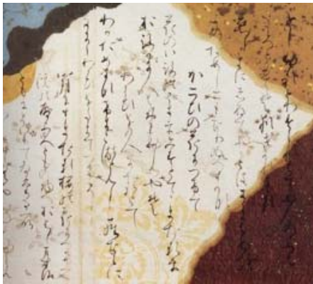
washi im Collagendekor

weiterer Unreinheiten bleicht man die Fasern in kochendem Wasser, oft säubert man sie danach noch einmal manuell. Dann werden sie mit einem Hammer bzw. Schlagholz - oder inzwischen mit einer entsprechenden Maschine - geschlagen. Von dem ursprünglich gerenteten Material sind zu diesem Zeitpunkt weniger als 10% übrig, die nun in einem Wasserbottich zu einer Pulpe verrührt werden. Mit dem Hinzufügen von neri bzw. nori beginnt das eigentliche Papierschöpfen: Mehrfach wird das Sieb samt Holzrahmen per Hand in die Flüssigkeit eingetaucht und hin- und hergeschwenkt, bis die gewünschte Papierstärke erreicht ist. Dies erfordert nicht nur viel Geschick und jahrelange Übung, sondern je nach Größe des Siebs auch erhebliche Kraft. Überdies sollten Papiermacher abgehärtet sein, da neri bei Kälte die beste Wirkung zeigt und daher washi bei niedrigen Temperaturen geschöpft wird. Ist das Blatt dick genug, löst man es vom Sieb und legt es auf den entsprechenden Papierstapel zum Pressen. Dann wird der feuchte Bogen mit einem Besen aus Pferdehaar auf ein Holzbrett - oder neuerdings mancherort auf eine Stahlplatte - aufgebürstet und in der Sonne getrocknet; heutzutage erfolgt das Trocknen oft auch im Gebäudeinneren durch Dampf.